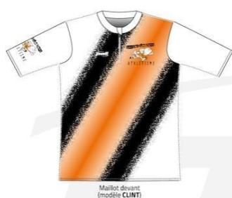
Maillot devant (modèle CLINT)